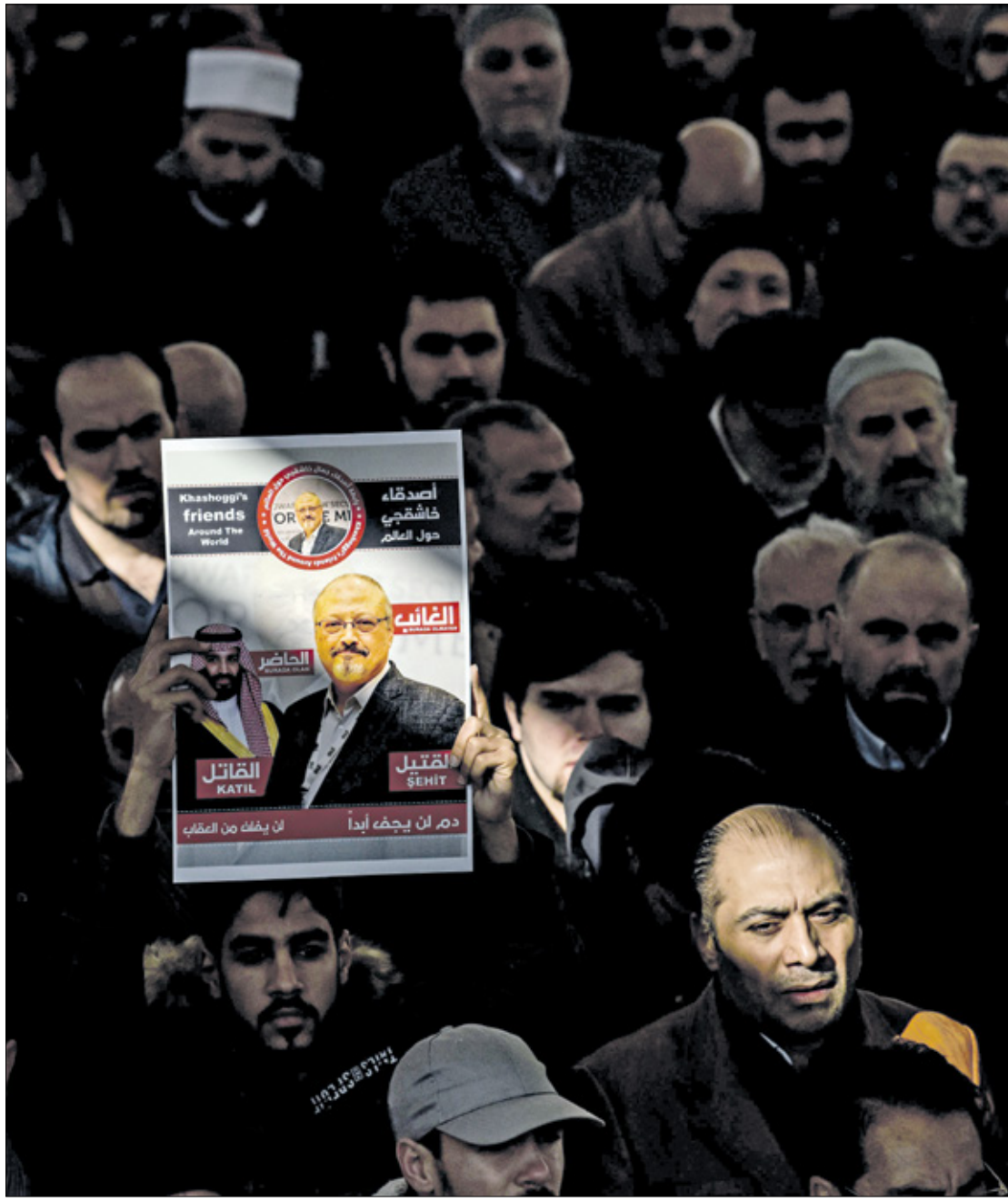
اغتيال خاشقجي عام 2018 في إسطنبول

وعلق عميد كلية السينما في «جامعة تشامبان»، ستيفن غالواي، بالإشارة إلى أن ما حصل «مخيب للآمال، لكن هذه الشركات العملاقة في سياق محموم من أجل البقاء»، وأضاف في حديث لـ«نيويورك تايمز»: «هل تظنون أن شركة (ديزني) ستقدم على خيارات مختلفة عبر منصتها (ديزني بلاس) أو (آبل) وغيرهما؟ هذه الشركات لديها ضرورات اقتصادية يصعب تجاهلها، وعليها أن توازن بينها وبين قضايا حرية التعبير».