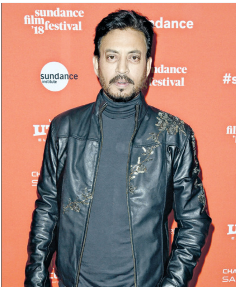
رحلة النجم الهندي عمران خان في إيرلندا لسياة الماضي

ذلك إلى تكوين صورة لدى البعض عن الوسط البوليوودي بأنه يفتقر إلى العدالة والمساواة، وفاسد جزاء انتشار تعاطي المخدرات. ولأخفّت المحملة سوراا ياسكرن كوفيد-19؛ لكن السينما الهندية التي نتجت واقعهم اليومي، تسمي إلى أن تستعيد بريقها في السنة الجديدة.