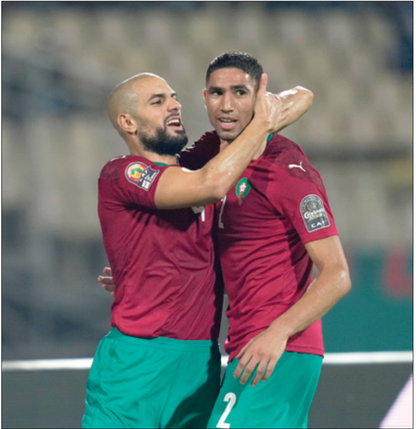
مرض حكيمي لمسه لهما في المواجهة