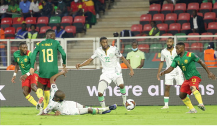
موقعة الكاميرون وجزر القمر اعادت المشهد مجددا

«كورونا» وهو ما لم يلتزم به المُشجعون على كل الأصعدة ، كما غاب التخليط المحكم وما حدث أصاب الكرة الأفريقية بالصدمة، ليفرض الاتحاد الأفريقي لكرة القدم «كاف» بدوره حالة من الطوارئ، لتتابعه الاحداث الدامية، واوقد سكرتيره العام المتابعة الاحداث داخل المستشفى المخصص لعلاج الضحايا والوقوف على الأسباب. وبدأت الواقعة المتساوية قبل بداية اللقاء عندما حدث تدافع جماهيري باعداد غفيرة، سعياً وراء الوصول إلى المدرجات لتشجيع منتخب الكاميرون في اللقاء، أملاً في حصد الفوز، والتاهل للدور ربع النهائي، قبل أن يسقط العشرات من الحصابين، ويجري الإعلان عن الوفيات ليرفع السواد نفسه داخل القارة السمراء على خلفية الحادثة. واصل «الكاف» بياناً رسمياً، نعى خلاله المشجعين، وأكد استمرار مُتابعته لسير التحقيقات من جانب السلطات الكاميرونية، للوقوف على اسباب هذه الحادثة المتساوية التي ضربت بقوة استقرار البطولة، وحالة النجاش التي جرى الترويج له على التنظيم الكاميروني «للكان» قبل أن يخرج رئيس الكاف في مؤتمر صحفي أكد فيه التزام اتحاده القاري بضمان سلامة المشجعين.