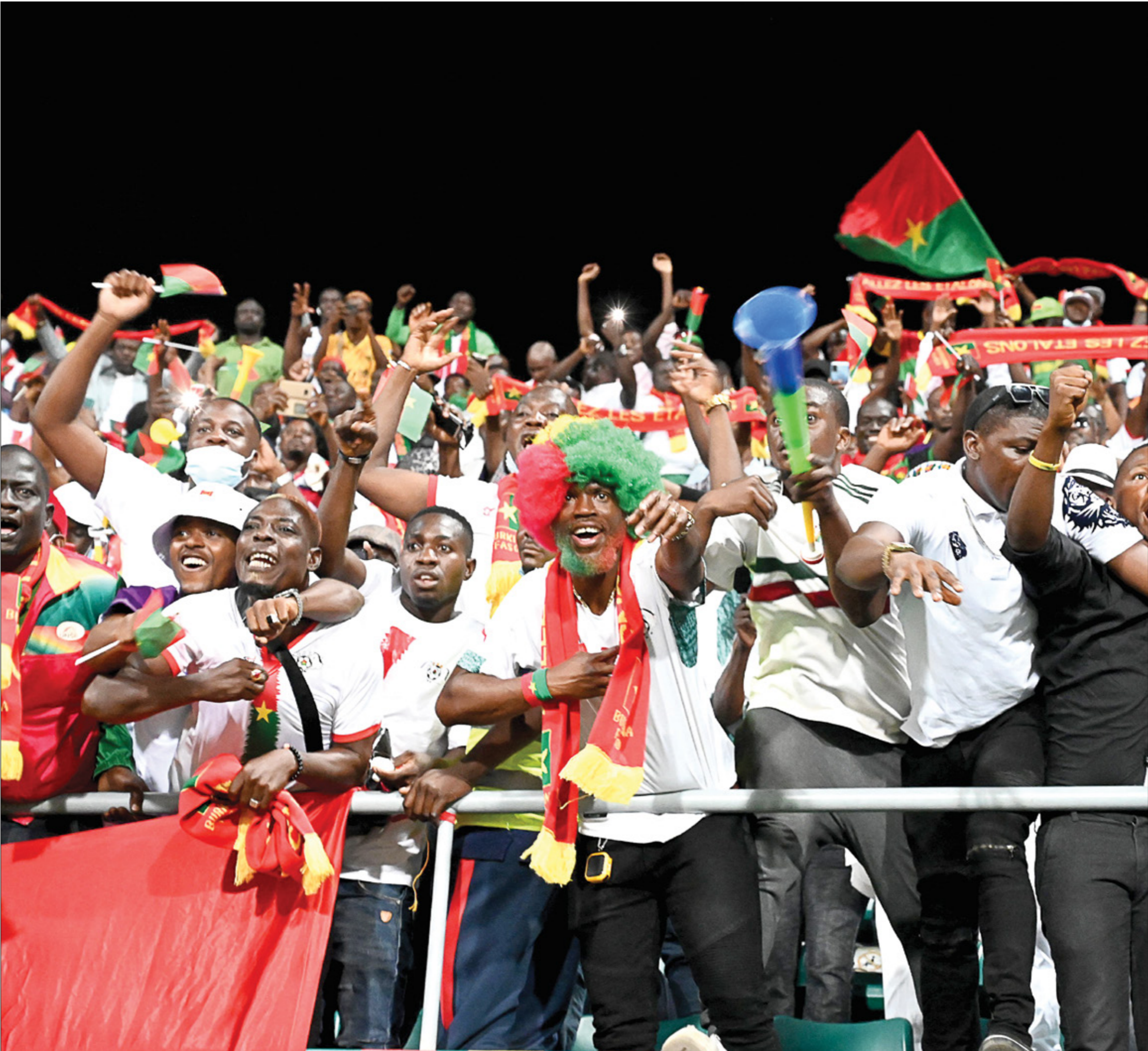
الجماهير عانت غياب ظروف السلامة في كان 2022