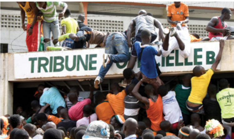
التدافع يودي لوفيات في صفوف المشجعين اسة كاميرون

وقجر ناصر بيا حاكم المنطقة الوسطى بالكاميرون المفاجأة المدمية، بالتاكيد على أن الحادث جاء بسبب التدافع للوصول إلى