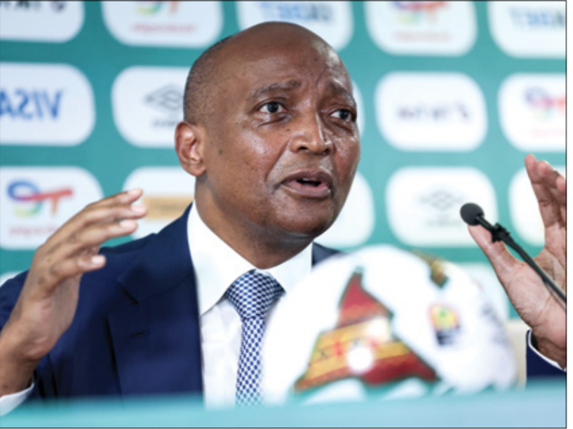
عبر رئيس الكاف: عن حزنه لما حدث في ملعب «أوليمبي»

على صعيد متصل، تقدم الاتحاد الدولي لكرة القدم «فيفا»، ونظيره الاتحاد الأوروبي «يويفا»، بواجب العزاء لجميع عائلات ضحايا ملعب «أوليمبي»، وأبدوا حزنها على ما حصل قبل مواجهة منتخب الكاميرون ونظيره منتخب جزر القمر الكاميروني، كما أرسلوا رسالة شكر لجهود الجميع في معالجة الحادث، وبتفكير في معالجة الحادث، وطالب السلطات الكاميرونية بتقديم تقرير مفصل عما حدث، لكن السؤال الذي يتبادر الآن، في ذهن جميع الجماهير الرياضية، هل حاول باتريس موتسيبي رئيس «الكاف»، ترتيب الفوضى التي يفوق بها صامويل إيتو رئيس الاتحاد الكاميروني في المسابقة القارية؟