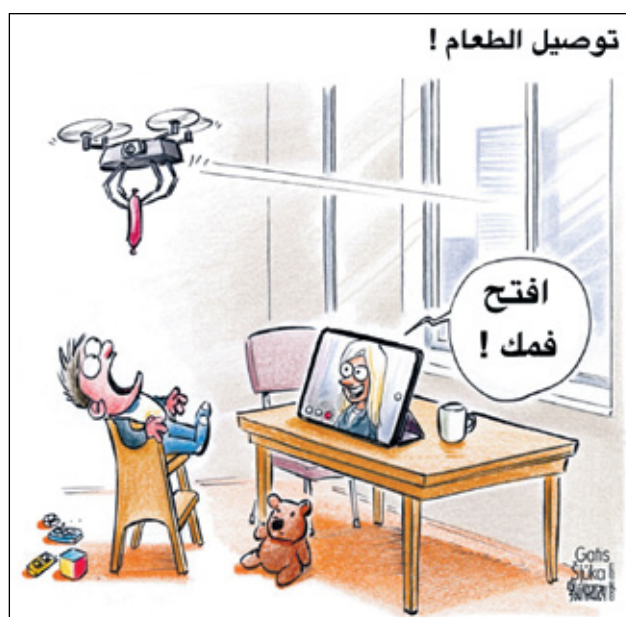
غائيس سلوكا/كيغك كار تونز