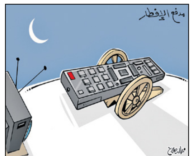
الريموت هو مدفع رمضان