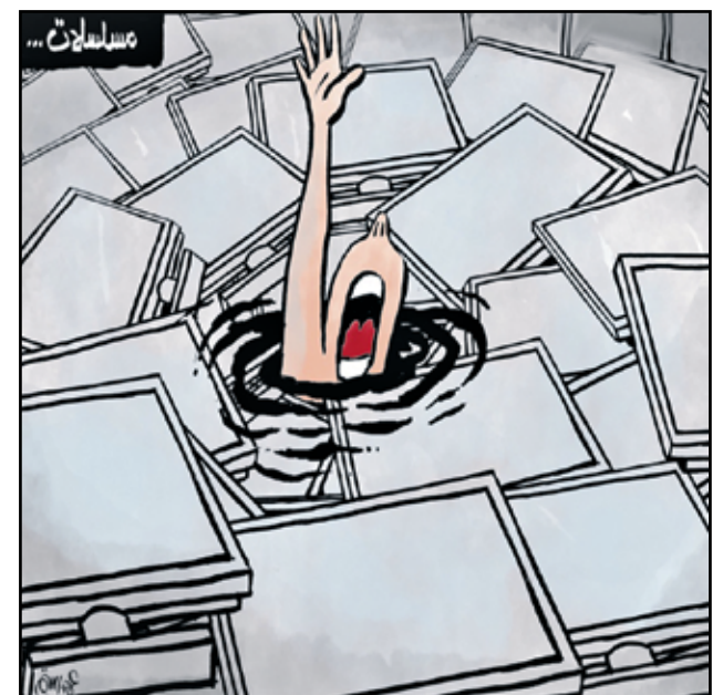
الغرف في مسلمات رمضان