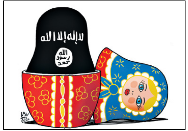
داعش ياكل من داخل الماتريوشكا الروسية (الآن لوزان/كار تون موفمنت)