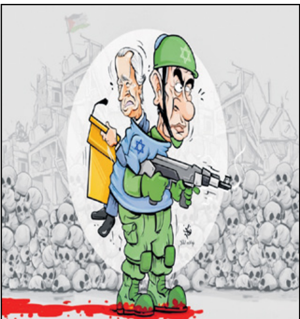
تنتياهو يتحدث جو بايدن