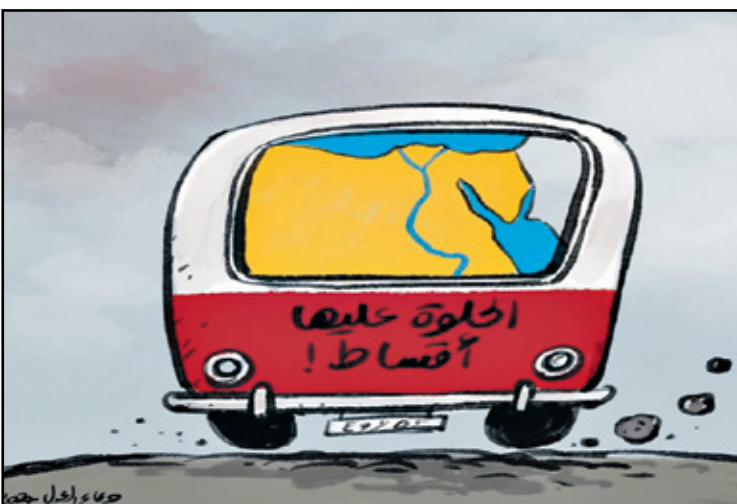
مصر تصرف في الديون (دعاء العدل/صفحة المنصة)