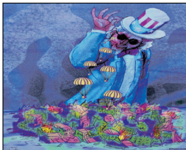
مساعدات اميركية كرشة ملح