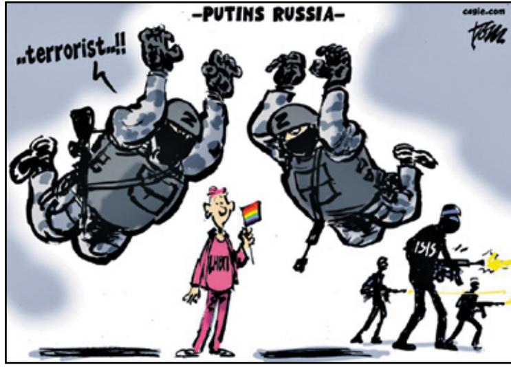
الامن يقبض على المثليين ولا يعثر على الإرهابيين (توم جاسن/كيغك كار تونز)

ثار العديد من التكهّنات بشأن ما حدث، لكن توافق الجميع على ضرورة تغيير نوع الأظعمة، لأن المسألة تمثل إجحافاً للعرب الذين يشعرون بعجز فادح حيال مواقفهم المشينة من غزة. غير أن الأمر تكرر ثانية مع الأظعمة الجديدة، وبالعبارة المخطوطة نفسها: لكن مع تزيينها بعبارة أخرى مفادها: «أنتم الجائعين انتظروا مساعداتنا». انعدت الألسنة كلها أمام هول الحدث، لكن الغريب أن الجميع (باستثناء الحكام طبعاً) شعروا بجوع لم يختبروه قبلاً.. والأغرب أنهم راحوا يتشوقون للمساعدات التي وعدتها بهم غزة، ولسان حالهم يقول: «لا جوع أقسى من جوع الكرامة».