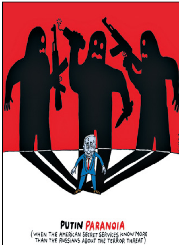
بوتين محرج لتجاهله تحذيرات اميركية بهجوم داعش (شوت/كيغك كار تونز)

هجوم موسكو الإرهابي هجوم داعش الإرهابي على قاعة للحفلات في موسكو أثار استنكاراً عالمياً، ورغم تراجع الرواية الروسية عن تحميل أوكرانيا مسؤولية الهجوم وإقرارها بمسؤولية داعش خراسان عن الهجوم، فقد تصاعدت انتقادات عديدة للرئيس الروسي فلاديمير بوتين كونه تلقى تحذيرات أميركية لكنه تجاهلها، إليكم رسومات من الكاريكاتير العالمي حول هجوم موسكو الإرهابي.