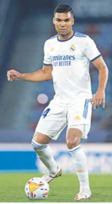
كاسيميو لتُخادر إسبانيا لتملك البرانك

اتفقت أندية كرة القدم الإسبانية المشاركة في رابطة الدوري الإسباني «الليغا» على إبلاغ لاعبيها الدوليين، الذين استدعتهم منتخبات اتحاد أميركا الجنوبية «كونميبول» لخوض التصفيات المؤهلة إلى مونديال قطر عام 2022، «بإستحالة السفر للانضمام إلى منتخبات» بلادهم، والشروع في اتخاذ إجراءات قانونية ضد تمديد أيام مباريات هذه المنتخبات، وتكرت رابطة الدوري الإسباني، في بيان رسمي بعد نهاية اجتماع الأندية المتضررة،، أن «الأندية اتفقت على إبلاغ لاعبيها الذين استدعتهم منتخبات كولومبول باستحالة السفر للانضمام إلى منتخباتهم، في انتظار أن يتضح الموقف والعضلة الحالية»، ويؤثر موقف الأندية الإسبانية على حوالي 25 لاعباً من 13 فريقاً، في انتظار معرفة من سيجري استدعائهم من جانب المنتخبين الكاودوري والفنزويلي، ويتمثل الدافع وراء القرار في معارضة أندية كرة القدم الإسبانية، المحترف بصرفها لاعبون استدعتهم منتخبات من أميركا الجنوبية للمشاركة في التصفيات المؤهلة لمونديال قطر، لتمديد فترة التوقف الدولية