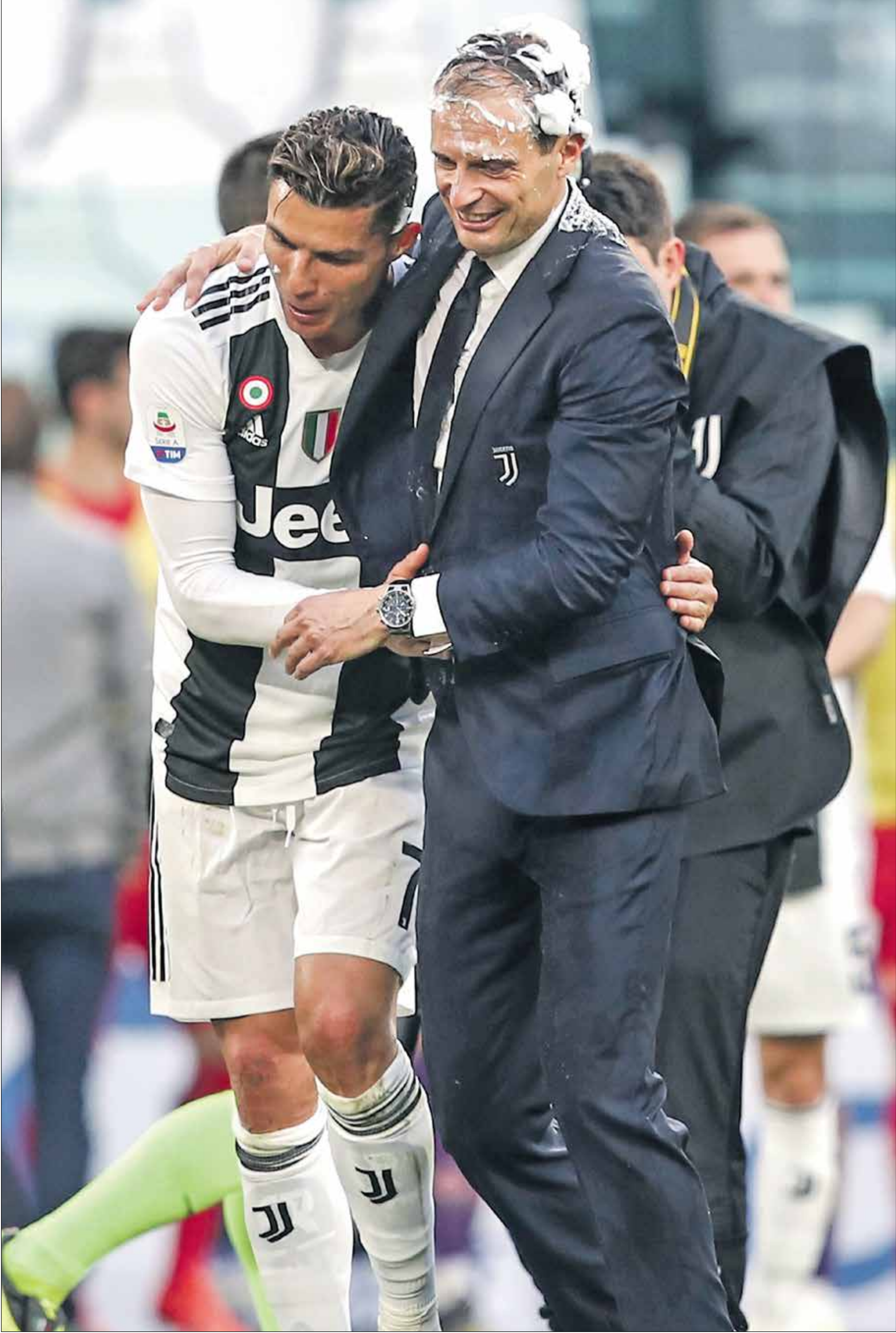
بعد تأكيد رحيل رونالدو يبدو انه بات اقرب لماشستر سيتي

انهى مدرب فريق يوفنتوس الإيطالي الجدل حول مسألة بقاء او مغادرة المهاجم البرتغالي كريستيانو رونالدو، وذلك خلال مؤتمر صحفي خاص قال فيه: «كريستيانو رونالدو أخبرني بالأمس بأنه يريد مغادرة يوفنتوس فوراً، هذا حقيقي ومؤكد، ولهذا لم يتدرب معنا ولن يكون متاحاً للمباراة القادمة. لست مستاءً منه، يريد الرحيل والبدء مع فريق جديد بعد 3 سنوات قضاها هنا».