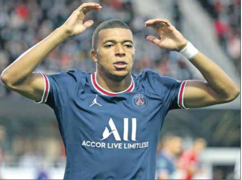
قدم ريال مدريد عرضا جديدا بقيمة 180 مليون يورو

جماهير فريق يوفنتوس الإيطالي، ووفقاً لموقع «فوتبول إيطاليا»، فإنه سيلعب مباراته الأخيرة ضد إيمبولي هذا الأسبوع قبل الانتقال رسمياً إلى «سيتي».