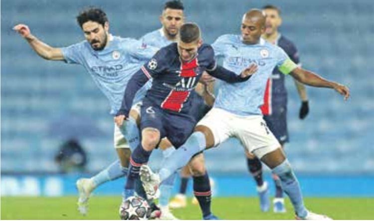
مواجهة ملظرة بين باريس سان جيرمان ومانشستر سيتي

البرتغالي سيورتيغ لشونة، ويوروسيا دورتموند الذي يمتلك في صفوفه لاعبين من المستوى الأول، يتقدمهم النرويجي إيرلينغ هالاند، ثم اياكس الهولندي الطموح بكرته الشاملة التي قد تصنع الفارق هذه المرة بقوة الشباب، كذلك بنشكتاش، الذي توج بطلا للدوري التركي بفضل هجومه المميز الذي يقوده الجزائري رشيد غزال.