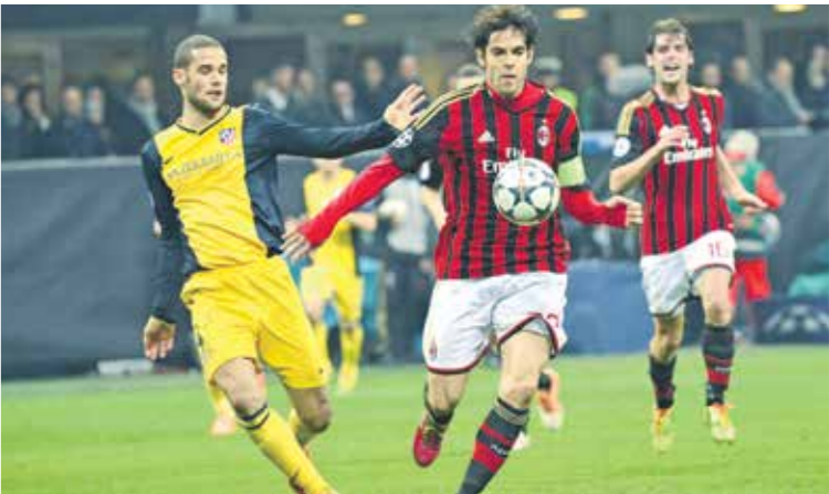
المجموعة الثانية ضمت ليفربول وميلان والليكو وبرشلونة،

ويطمح المدرب الألماني يورغن كلوب، المدير الفني لنادي ليفربول الإنكليزي، إلى الانتقام مما فعله به سيميوني، الذي استطاع تجريد «الريدز» من لقب دوري الأبطال في الموسم ما قبل الماضي، وتمكن أتلتيكو مدريد من تحقيق الفوز في مواجهة ذهاب الدور الـ16) في موسم 2019/2020 بهدف تخفيف، لكن «الروخيبلاكتوس» حقق المفاجأة الكبيرة حينها، بعدما هزم رفقاء المصري محمد صلاح في الإياب على ملعب «أنفيلد» بثلاثة أهداف مقابل هدفين. وستشهد المجموعة الثانية أيضاً مواجهة ثارية خالصة لجيلان الإيطالي، الذي يبنى نفسه بالانتقام من أتلتيكو مدريد، الذي استطاع الفوز عليه في مواجهتي الذهاب والإياب بالدور الـ16) في موسم 2013/2014، ومع أن المجموعة الثالثة أقل قوة من سابقتها، غير أن أنديةها تمتلك الكثير من الخبرة والعراقة، حيث تتكون من بطل الدوري