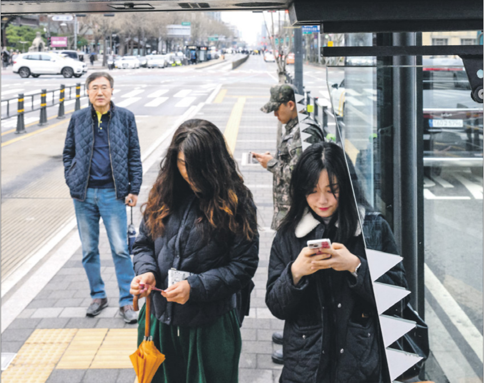
الناس في ولاح، فرانس غرب)