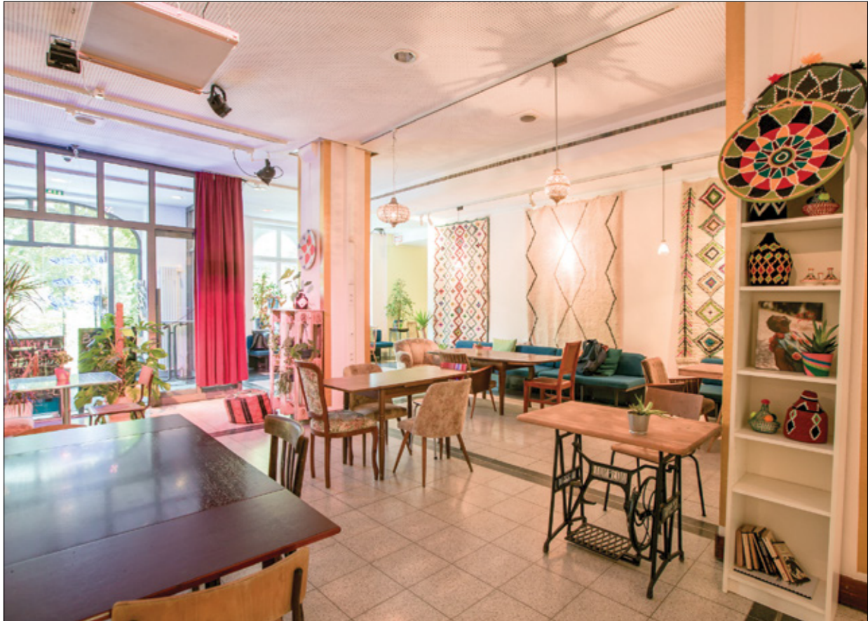
من احد فضاءات مركز «عيون» في برلين