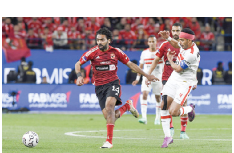
الاهلي يسعى لتسجيل الانتصار

مهمة شاقة تنتظر الاهلي المصري (حامل اللقب) الليلة، عندما يحل ضيفا على سيمبا التنزاني في لقاء مثير على الملعب الوطني في تنزانيا، ضمن افتتاحه جولة ذهاب الدور ربع النهائي من بطولة دوري أبطال أفريقيا لكرة القدم موسم 2023-2024. ويدخل الاهلي المصري خارج ملعبه، تحديا صعبا، بحثا عن نتيجة ايجابية، وتجنب شبح الخسارة أمام فريق سيمبا المميز، الذي يؤدي كرة قدم هجومية جيدة، والاقتراب من الدور نصف النهائي، وخوض الاهلي مواجهة سيمبا، وهو يعول على خبرات مدربه السويسري