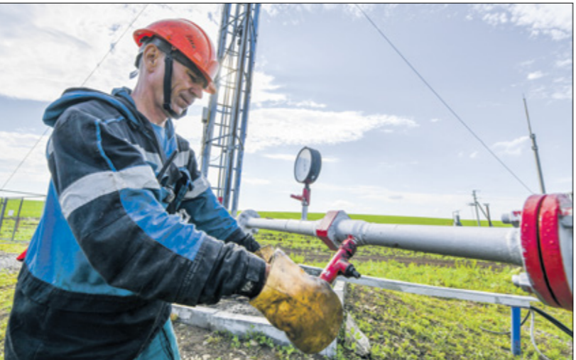
معاملة دعم اسعار النفط الكسندر هارلوت،الاسطول

لكن في خطوة مفاجئة، قالت روسيا إنها ستخفض طوعا 471 ألف برميل يوميا من إنتاج وصدرات النفط الخام خلال الربع الثاني من هذا العام. هذا بالإضافة إلى التخفيض الطوعي بمقدار 500 ألف برميل يوميا الذي أعلنته روسيا سابقا في إبريل/