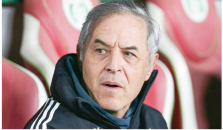
مارسيل كولر المدير الفني للهلي