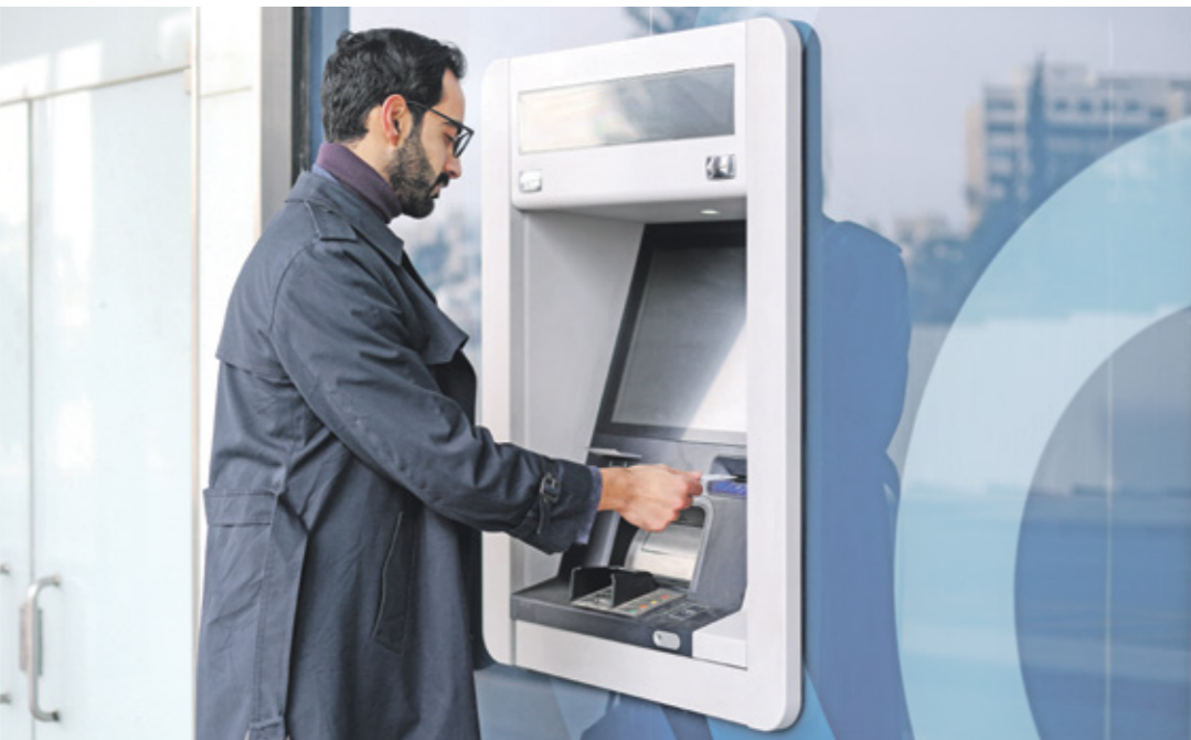
رصيد الودائع بالدينار بلغ 34,4 مليار دينار فيه 2023

وقال إن قرارات رفع أسعار الفائدة الأخيرة استندت إلى التزام البنك المركزي بالحفاظ على الاستقرار النقدي في الأردن من خلال المحافظة على جاذبية المدخرات بالدينار الأردني، بالإضافة لاحواء الضغوط التضخمية الناتجة عن الطلب المحلي. وتعد الضغوط التضخمية الأساسية للمواطنین في الأردن لإيداع أموالهم من ناحية ارتفاع عوامل التضمان والعوائد، وتقاديا للتخاطر التي قد ترتب عن استثمارها بأوجه أخرى أو التخلي عن الودائع بالدينار الأردني لدى البنوك العاملة في الأردن إلى 5% و6% فيما السمر الأغلب على الودائع بالدولار 1%.