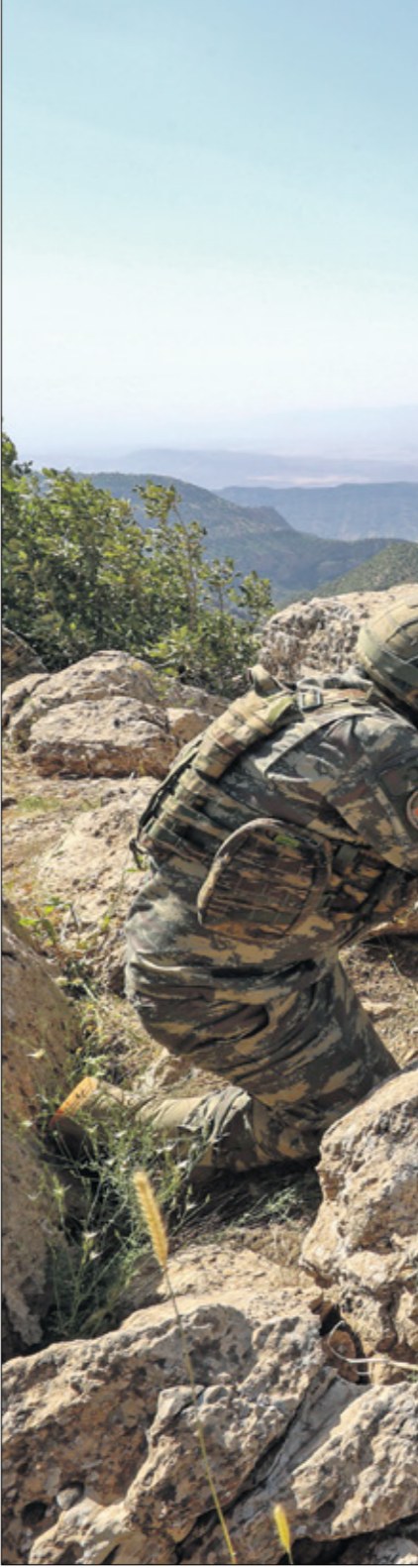
جندي تركي في دهوك العراقية، يوليو 2023 (كان يطلق على الطوارق)

«زيارة تاريخية»، وأنه «من المؤمل أن تكون نقلة نوعية في العلاقات بين البلدين». بدوره، أعجب الخبير بالشأن العراقي الكردي الضابط الساسي في قوات سوريا الديمقراطية، لذا قد تكون طويلة زمنيا وتعتمد على فكرة قضم أراضي سيطرة الكردستاني تدريجيا، ما يعني قطع شرايين إمداد ونقل الحزب بين البلدين». ولغت إلى أن أربيل أمام تحد أممي آخر، وهو منع انتقال مسلحي «الكرديستاني» إلى مناطق جديدة داخل الإقليم، حيث تراجعهم من مناطق وجودهم الحالية وختم المرتقبة إن «بغداد تجد نفسها بحاجة إلى تركيا في ملف المياه