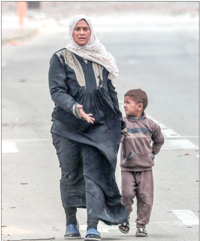
صنعة، ابت، أهم؟ حركة بركة بظنر بئرة الشلاء والحراب

هذه الحملة ليست الأولى من نوعها؛ أطلق العديد من المهتمين والمنظمات حملات تهدف إلى جمع شهادات وتصوص للفلسطينيين عامة من قطاع غزة، تقرأها شخصيات عامة من قاتين ومسلمين ومغتنين، في سبيل الحشد والتذكير الدائم