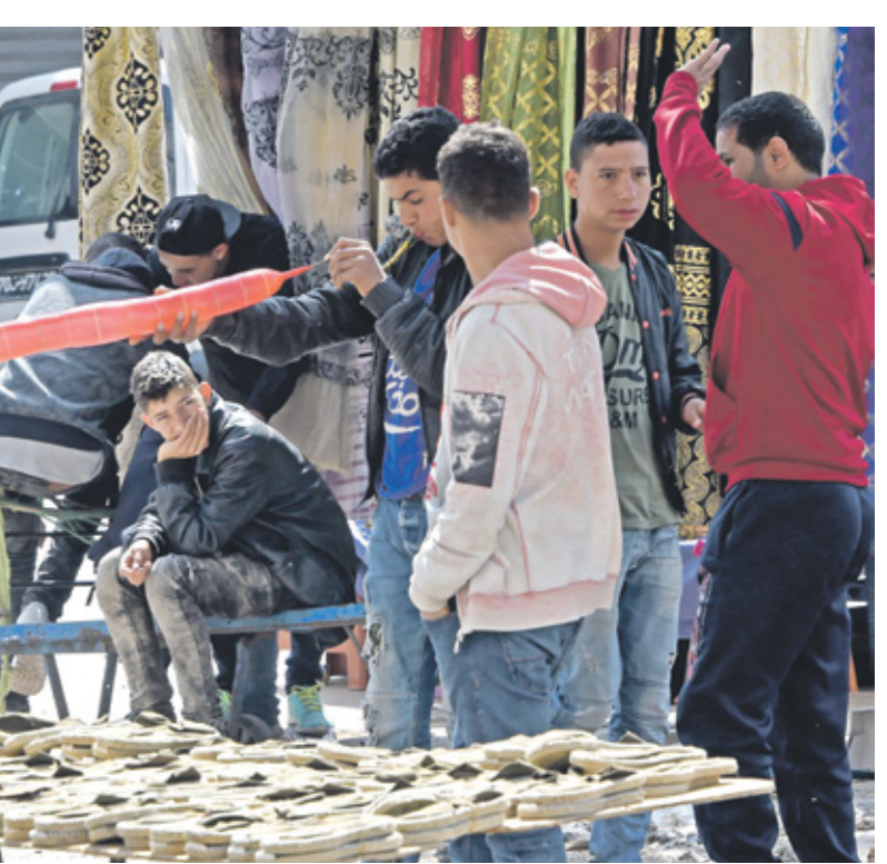
المواطنون يشتكون من ارتفاع الاسعار

لم يستجب مجلس إدارة البنك المركزي التونسي لتخططات قطاع الأعمال الذي كان يتربط بخفضا لسعر الفائدة عقب تسجيل تراجع مهم في نسبة التضخم التي تحاربها مؤسسة الإصدار المالي منذ أكثر من سنتين بإجراءات متشددة. وأعلن البنك المركزي التونسي أنه قرر الإبقاء على سعر الفائدة دون تغيير في حدود 8 بالمائة. وقال المركزي في البيان الصادر عن مجلس إدارته إنه «قرر الإبقاء على نسبة الفائدة الرئيسية للبنك المركزي التونسي دون تغيير، في مستوى 8 بالمائة».