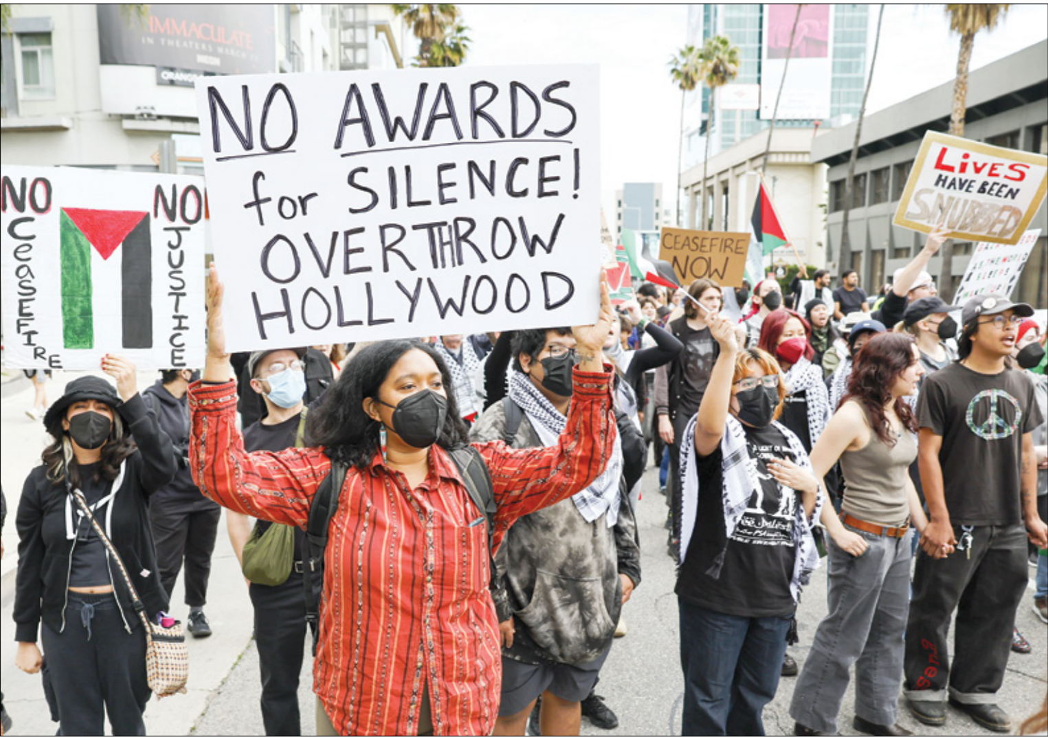
متاحرين للفلسطينيين في هوليوود

وقد جرى تفصيل هذه المخاوف في ملخص من ثلاث صفحات لإجتماع ورد أنه عُقد في نوفمبر/ تشرين الثاني الماضي، أي بعد شهر من بدء العدوان الإسرائيلي على قطاع غزة