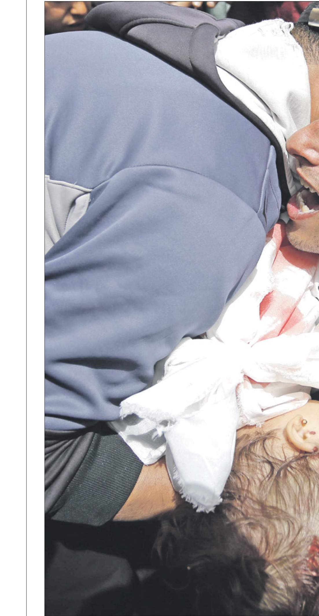
(أرنا، ابو عمرة/التناول)