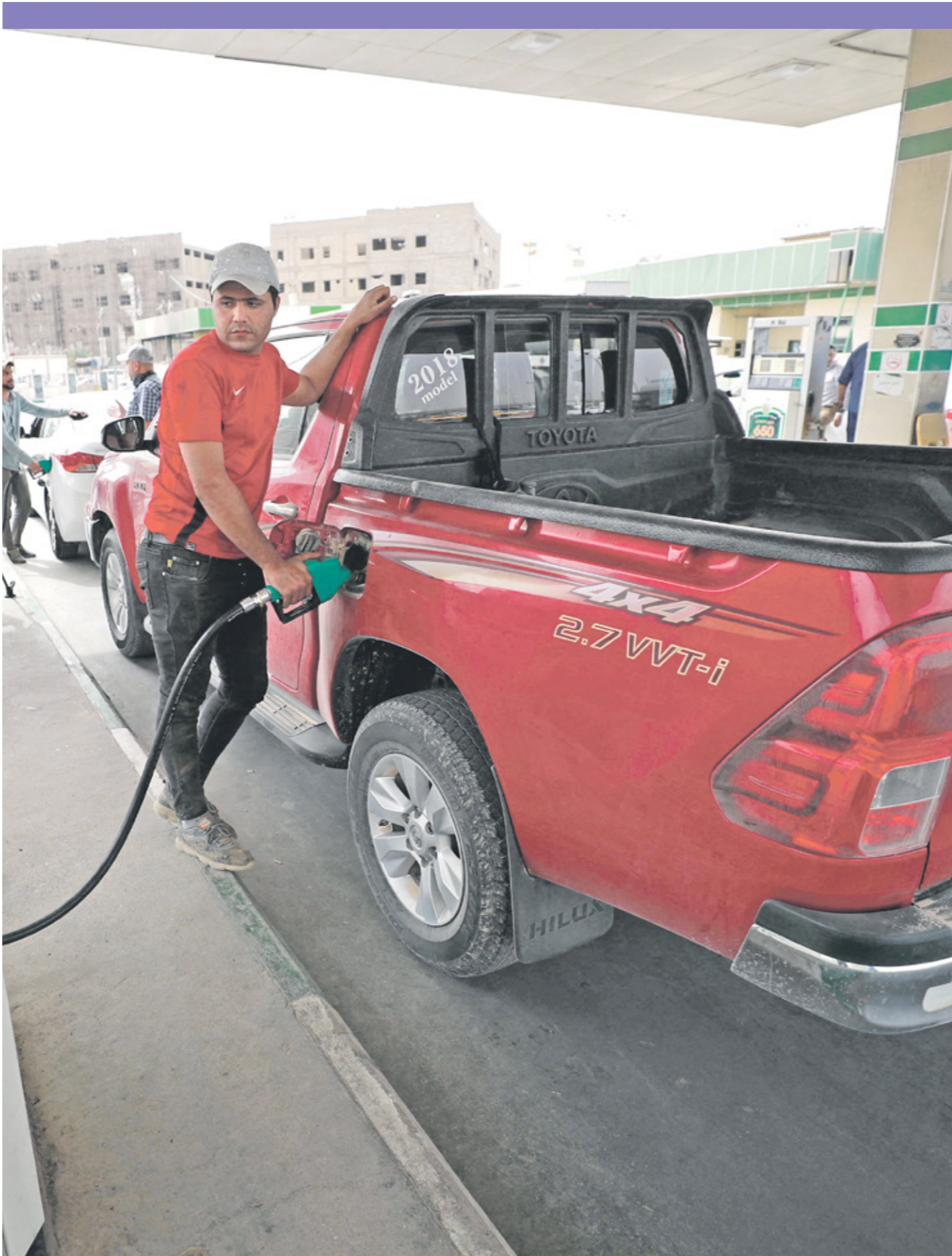
اسعار البنزين المحسن ارتفعت بنسبة 30% والسوبر 25%