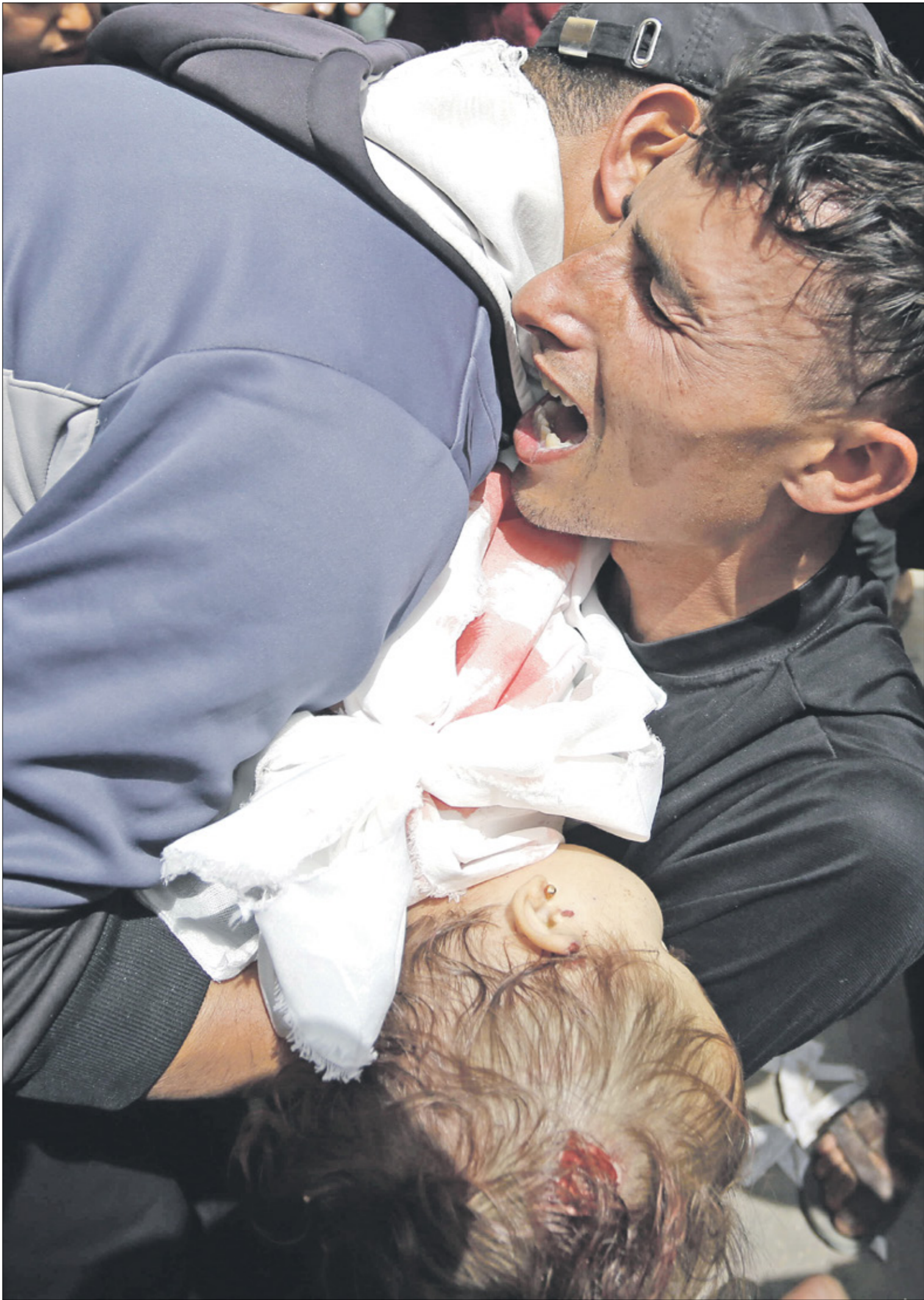
(أرنا، ابو عمرة/التناول)