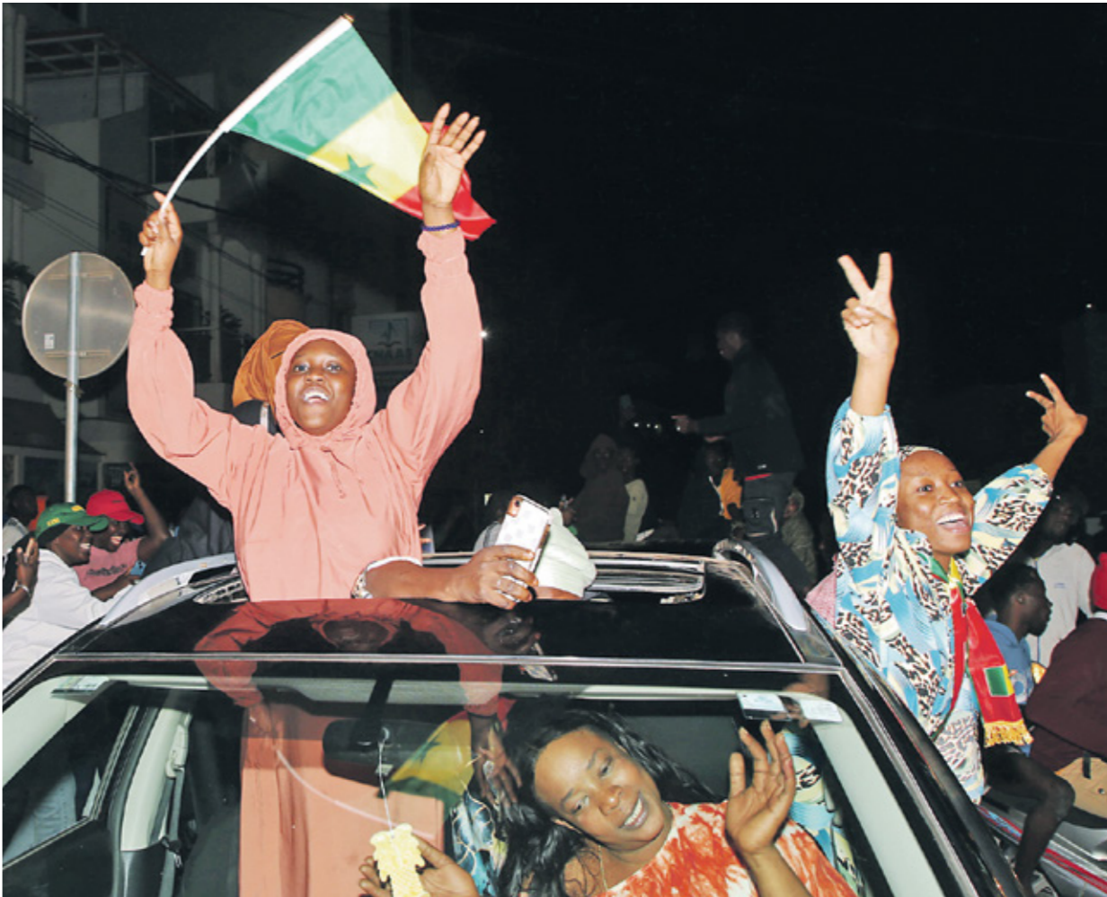
انصار فاي يحتفلون بفوزه الأحد، في حكاك

بعد هذا الفوز صاد يتنظر السنغال من فاي؟ وهل سيتمكن هذا الأخير من حل جميع الخلافات وتقريب وجهات النظر وراب الصعد داخل الطبقة السياسية، وهل الانتخابات الحالية كافية لإزالة الاحتقان والتوتر في الشارع؟ في هذا الصدد، يقول الباحث السنغالي لين يا أحمد، في حديث «العربي الجديد» إن الانتخابات أبحث تصدك السنغاليين بالتقييم والمبادئ الديمقراطية وأعطت مثالا قويا على ما يمكن أن تفعله إرادة الشعب ليواصل معتقل سياسي، أفرج عنه 10 أيام قبل التصويت، إلى سدة الحكم. ويشدد على أن النصر في هذه الانتخابات هو انعكاس لعملية «الانتخابية»، متابعيا «هم يبحثون وهو أيضا تحذير مزود للرئاسة الأفارقة الذين يرفضون الخلقى عن الحكم ويرغبون بالتصديق في كل فترة، ورسالة قوية موجهة