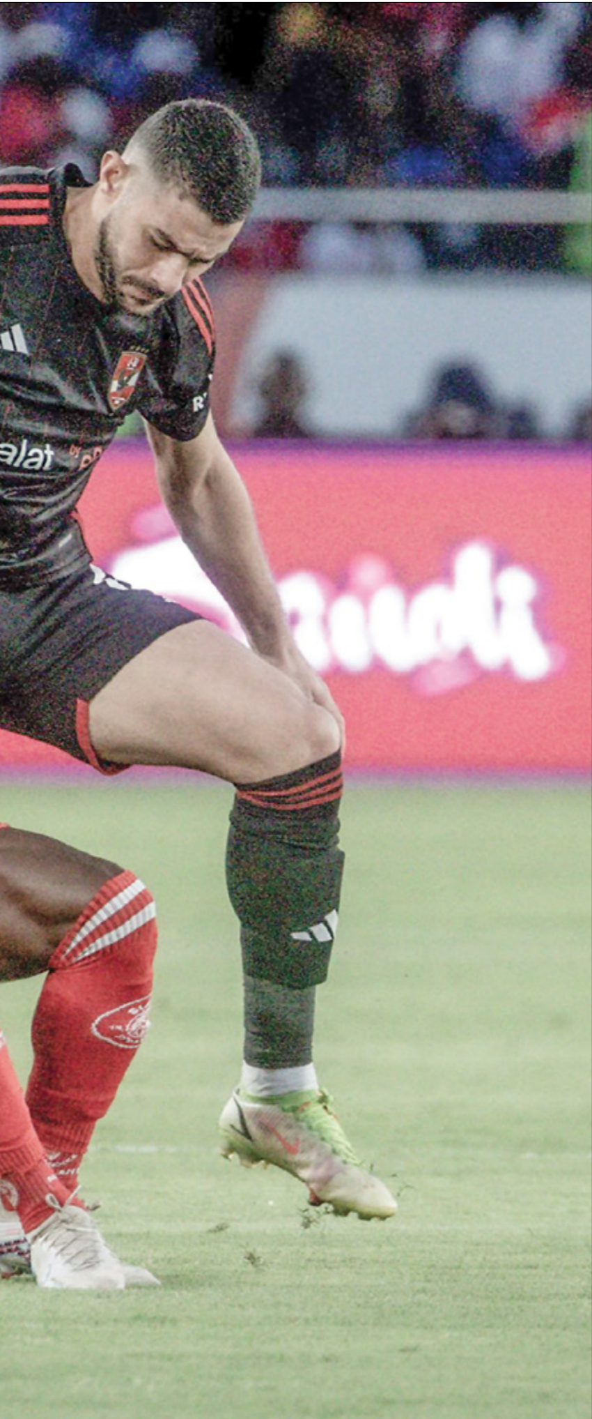
مواجهة مجددة بين الاهلي وسيمبا التنزاني

وتنقل موقع «سورسبورت» باللغة الفرنسية، تصريحات وولف بخصوص مستقبل الفريق، الذي يبحث عن خيار قادر على تعويض السائق البريطاني، والعودة إلى المنافسة على الألقاب، حيث قال: «المؤكد أن لدينا مكانا شاعرا بعد رحيل هاميلتون، ونحن الفريق الوحيد من بين أفضل الفرق