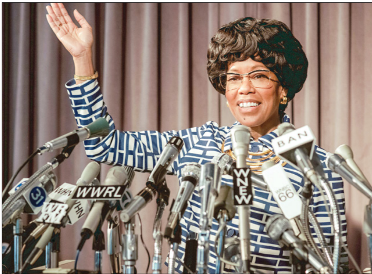
ريجينا كينغ في شخصية شيرلي تشيزوم، جمال أداء (المناف الصمام)

في القسم الثاني، يقول «عصابات» بموشور الحلح انشاء الساسون عن تغلغل المتطهر الديني في التصوّر الجماعي المغربي، حين يتوحّد، بين الفنية والأخرى، مع الرؤى الكابوسية لآل، ويُركّب الذنب الذي يستولى عليه، هناك أيضاً تبادل مُشغل يسلمة بين الأب والابن في فترات الأفلم بالتوازي مع مقاربة إخراجية خافتة، تُنجح في محو معالم الزمن بفضل الانخراط في الشعور النسي بمدة المشاهد، وتعطي الانطباع بأن الأحداث تجري على امتداد