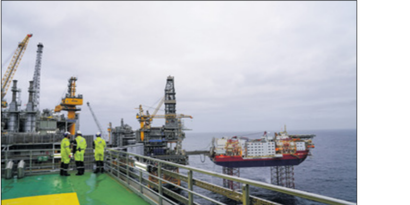
منصة السّاح النفط في بحر الشمال تابعة لشركة كوينور النرويجية

إستلوك . العربي الجديد تعتزم شركات النفط والغاز العاملة على الجرف القاري النرويجي إتفاق 247 مليار كرونة (24 مليار دولار أمريكي) هذا العام، مما يعكس نمو الاستثمارات في التنقيب وفي الحقول القائمة حاليا هناك، ومن المتوقع أن يقفز الإنفاق على استخراج المواد الهيدروكربونية ونقل خطوط الإنباط بحسبة 15% خلال 2024، مقارنة بـ215أ مليار كرونة أنفقت في العام الماضي، وفقاً لما ذكرته هيئة الإحصاء النرويجية،أسس الثلاثة، وتقدر الهيئة، بحسب ما نقلت وكالة بلومبيرج الأمريكية، أن يصل الإنفاق في عام 2025 إلى 216 مليار كرونة،