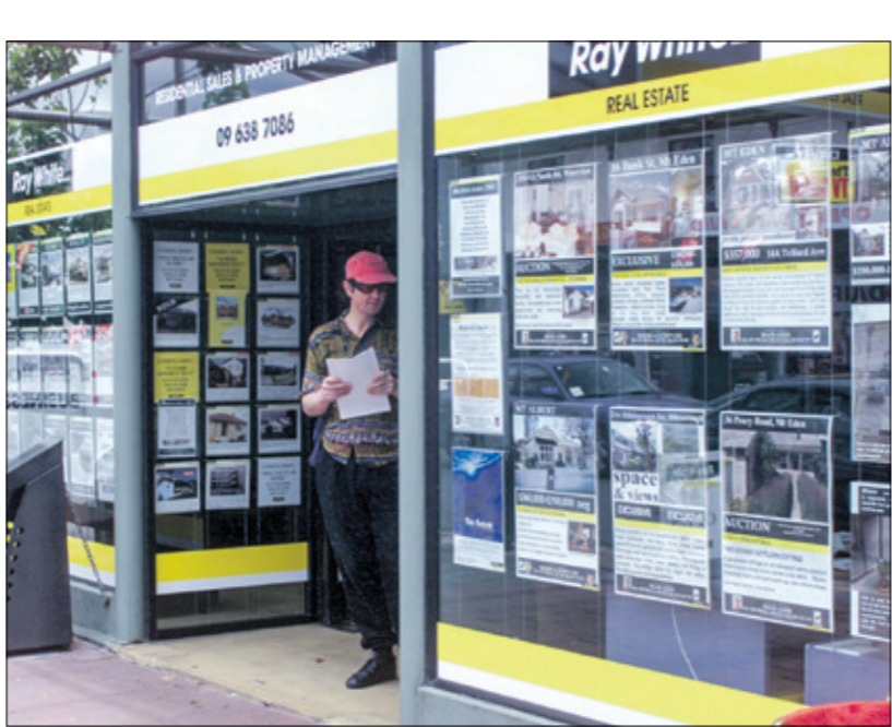
مكتب عقارية في أوكلاند، 3 يناير 2001

فرض البنك المركزي النيوزيلندي قيودا على الإفراض العقاري، وسط ارتفاع الديون وإسعار المنازل، مشددا على أن سياسته تهدف إلى ضمان بقاء أسعار العقارات عند مستويات مستدامة الحد من حالات التخلف عن السداد عن طريق تقليل حجم الخسائر المحتملة في حالة تراجع سوق الإسكان»، وقال كريستيان هوكسي نائب محافظ البنك، إن خطوط المركزي تعمل بحماية حواجز حماية تقلل من تراكم الإفراض عالي المخاطر في النظام المصرفي. بدوره، قال ستاتش راشود، كبير