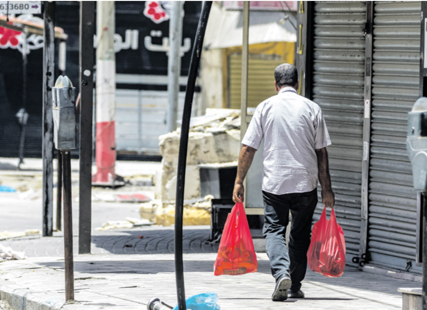
فلسطيني يحمل أكنتاجاله فيه شارع بجلبته يوم 22 مايو 2024 توجه بهي صفح